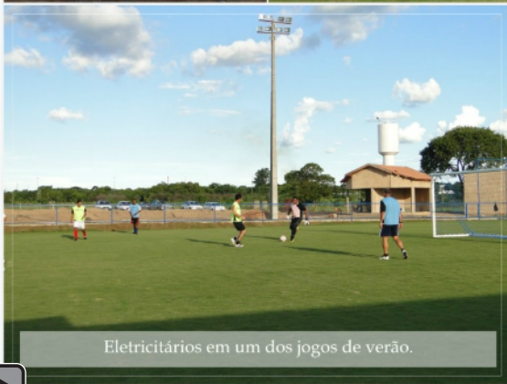
Eletricitários em um dos jogos de verão.

P ara compor os campos de futebol, foi feita uma grande pesquisa em Campo Grande sobre gramas e sistemas de irrigação. Hoje o gramado do clube pode ser considerado um dos melhores da cidade.