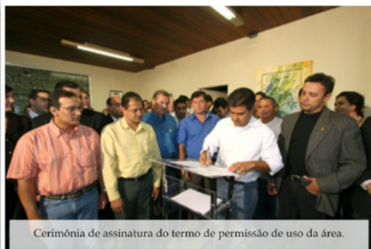
Cerimônia de assinatura do termo de permissão de uso da área.

O Sinergia-MS finalizou ainda em 2010 as obras de construção da primeira etapa do Clube dos Eletricitários de Mato Grosso do Sul. Ela consiste na infraestrutura do clube como água (poço artesiano), energia, terraplanagem, construção de muro, casa do caseiro, vestiários, campos de futebol e alguns quiosques.