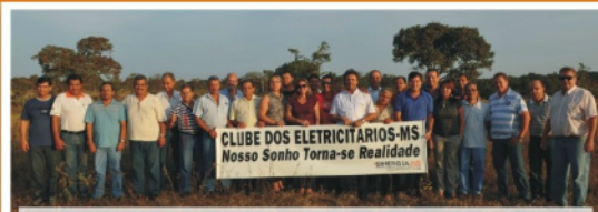
Direção do Sinergia-MS durante o lançamento da pedra fundamental.